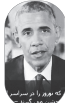
که نوروز را در سراسر جشن می‌گیرند

اظهارات وزیر خزانه‌داری آمریکا در روز ۲۶ اسفند در حالی است که تنها دو روز بعد رئیس‌جمهور آمریکا در پیام به اصطلاح نوروزی خود به صراحت انجام تمام تعهدات ایران را تایید می‌کند: «ایران دو ماه پیش به تعهدات کلیدی‌اش بر اساس آن توافق عمل کرد. ایران اکنون بخش‌های کلیدی برنامه اتمی‌اش را به عقب بازگردانده است و... پیامی که در همان اول، نمادها و عبارتهایی چون سفره هفت‌سین، سبزی پلو و نان‌نچی در آن خودنمایی می‌کردند تا خیمه‌شب‌بازی نزدیک شدن نمادین کاخ سفید به ملت ایران را ناشیانه به نمایش بگذارند. البته آمریکایی‌ها هنوز هم ملت ایران را نشناخته‌اند که از این مدل برای فریب مردم استفاده می‌کنند. پیامی که در ادامه‌اش آمده است: «در مقابل جامعه جهانی تحریم‌های مشخصی علیه ایران را برداشت و ایران به پولی که در خارج از این کشور مسدود شده بود دسترسی پیدا کرد... ممکن است برای شما مردم ایران مدتی طول بکشد تا مزایای رفع این تحریم‌ها را در زندگی روزمره‌تان احساس کنید، اما مزایا غیر قابل انکارند.» نقطه مقابل این حرف را نشریه آمریکایی پالیتیکو می‌گوید: «ممکن است درهای ایران بعد از توافق هسته‌ای تاریخی با غرب به روی تجارت گشوده شده باشد، اما